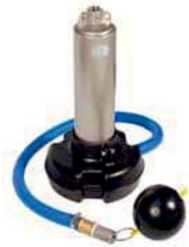
Pumpenfuß, Möglichkeit zur schwimmenden Entnahme