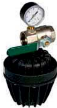
Anschluß Kit Pres Darstellung enthält optionales Zubehör, Kitpres im Preis enthalten.

Mediumtemperatur: 5-35 °C. Maximaler Anlagenhöhe 15/25m Maximale Schaltzeit / Stunde 30 mal Nur zum vertikalen Betrieb geeignet